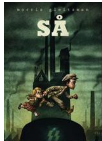
Så er oppfølgeren til En gang, en spenningsroman for barn om Holocaust, skrevet av Morris Gleitzman.

Opgaven setter fokus på forskjellen mellom fakta og stemningsskildring, elevene skal bli bevisste på at fakta