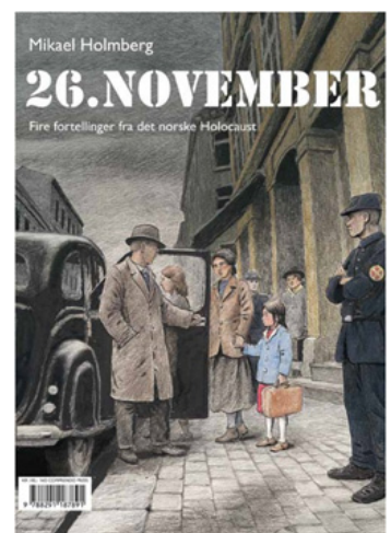
Forsiden av tegneserien 26. november , en tegneserie basert på fire overlevelsesberetninger fra Holocaust i Norge.