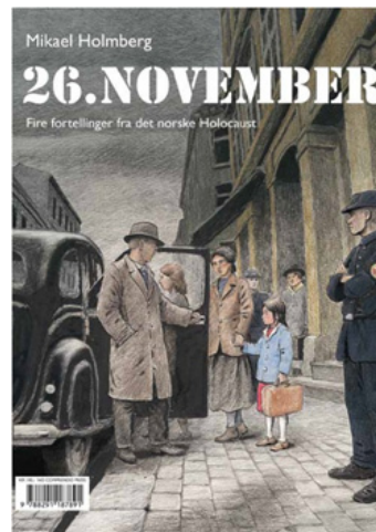
Forsiden av tegneserien 26. november, en tegneserie basert på fire overlevelsesberetninger fra Holocaust i Norge.