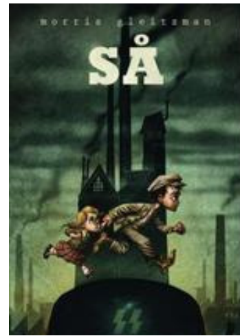
Så er oppfølgeren til En gang, to spenningsromaner for barn om Holocaust, skrevet av Morris Gleitzman.

Så løp vi for livet, jeg og Zelda, opp en bakke så fort vi kunne.