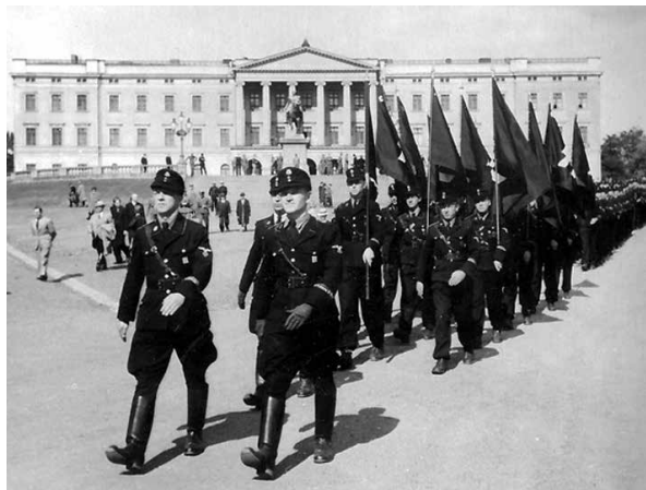
Germanske SS-Norge foran slottet.