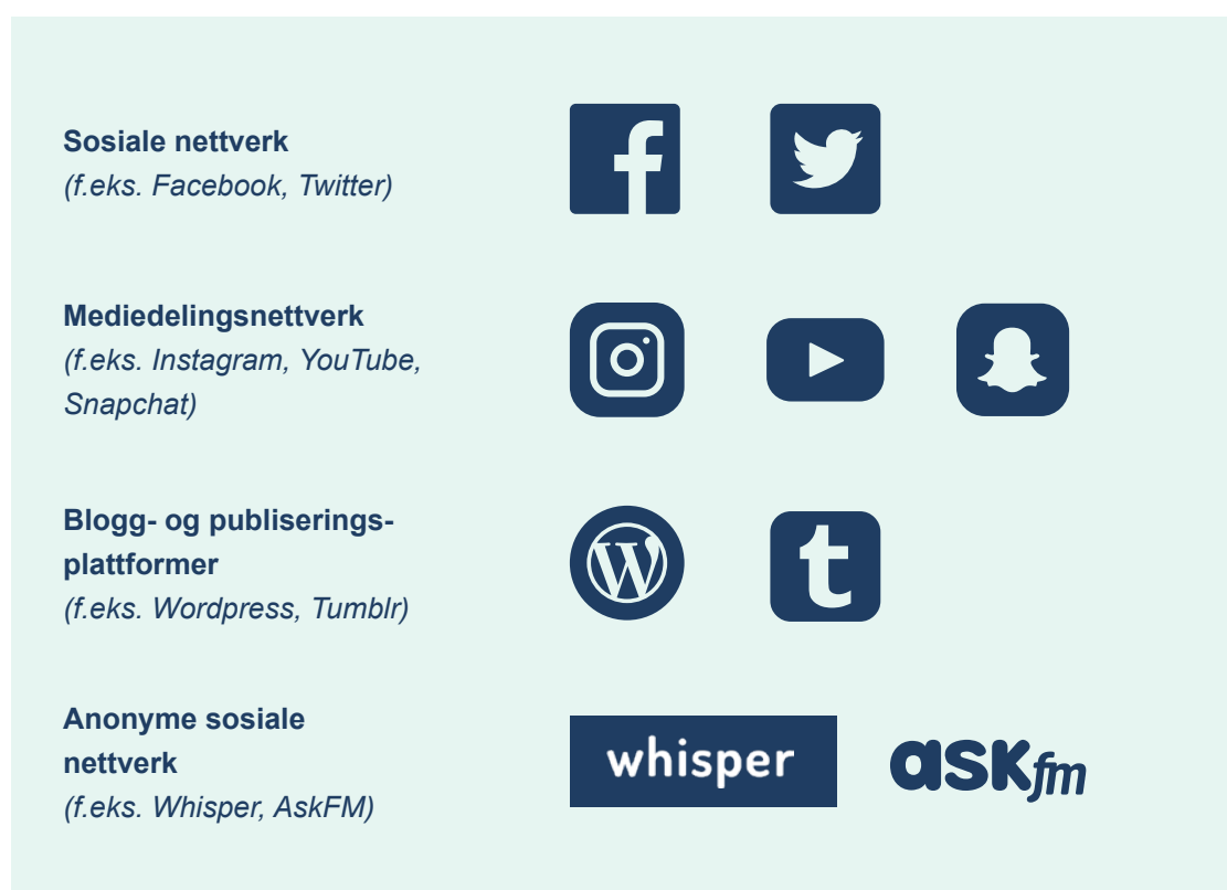
Figur 4. Noen eksempler på sosiale medier

Det kan også være nyttig å identifisere ulike kategorier av sosiale medier, drøfte hvordan de fungerer, hvem målgruppen er, og hvorfor folk bruker dem. Sosiale medier omfatter: